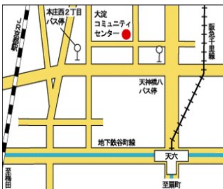
大淀コミュニティセンター